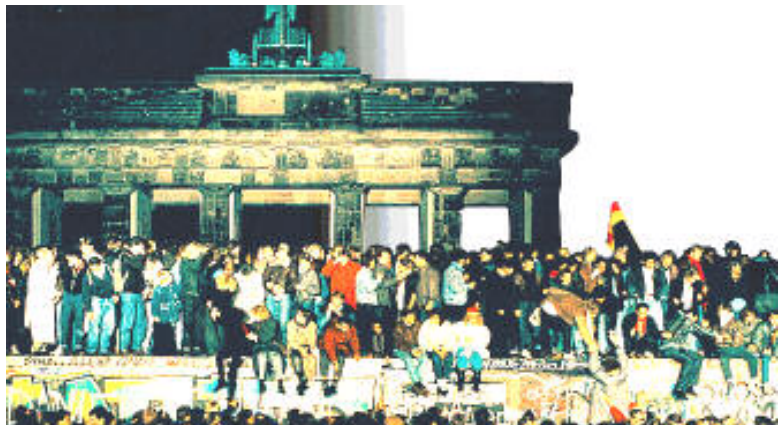
DOC.3. La construction du mur de Berlin (1961, à gauche) et la population de Berlin sur le mur après l'ouverture du mur (9 novembre 1989, à droite)